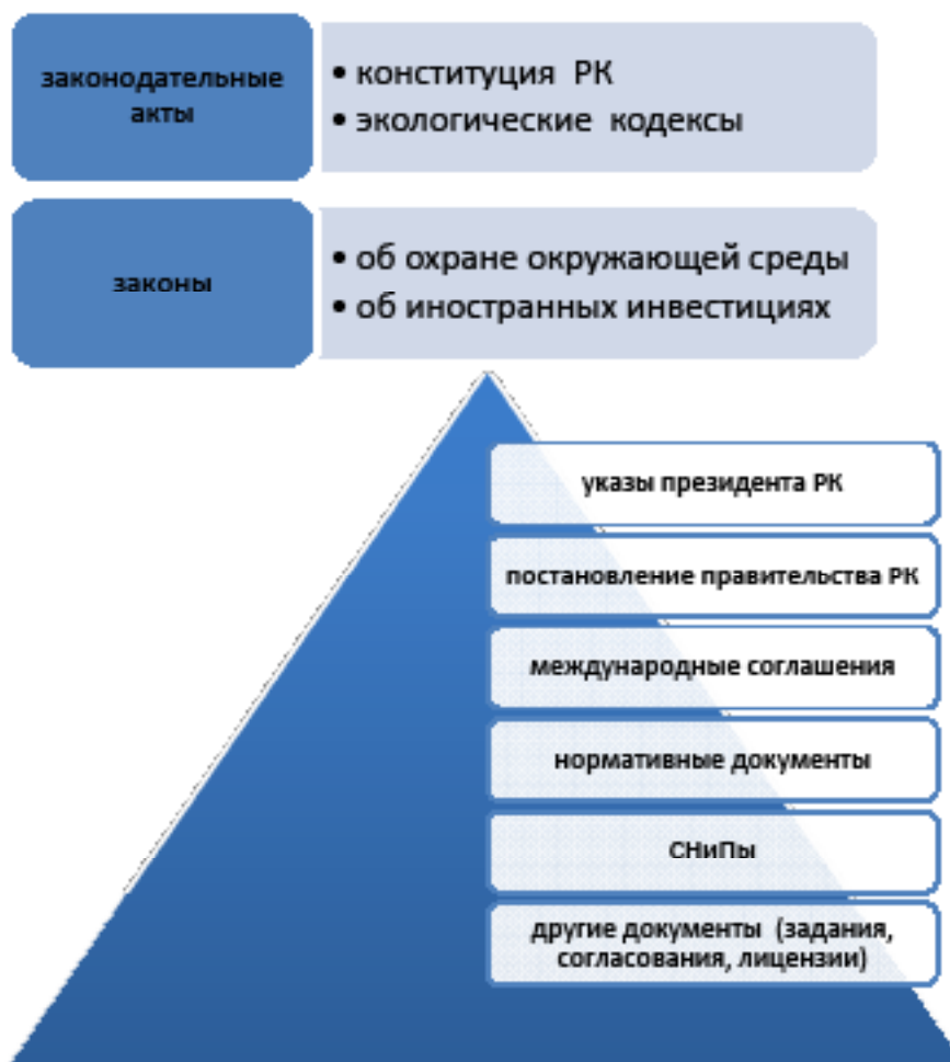
Рис. 1. Экологическое законодательство Республики Казахстан (согласно законодательству)

Основной целью разработки экологического обоснования в предпроектной и проектной документации является предотвращение или снижение экологически вредного воздействия на окружающую природную среду при новом (капитальном и некапитальном) строительстве, расширении, реконструкции, техническом перевооружении предприятий, установке нестационарных объектов, консервации и ликвидации объектов, а также сохранение природных ресурсов и создание благоприятных условий для жизни людей путем всестороннего комплексного рассмотрения всех потерь и преимуществ, связанных с реализацией намечаемой деятельности.