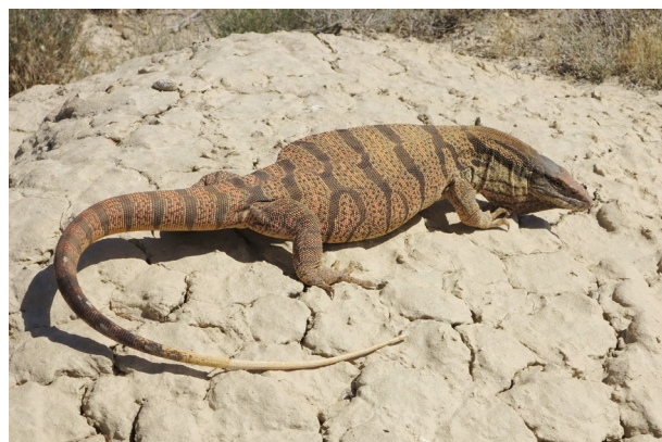
Рисунок 1 – Внешний вид серого варана из Казахстана

чезновения (CITES). На территории Казахстана морфологическая изменчивость серого варана изучена недостаточно. Известны данные по размерам длины туловища и хвоста 15 взрослых особей и 4 полувзрослых (Брушко, 1995: 200), а также общее описание рисунка взрослых особей (Параскив, 1956: 90-91). Других сведений нет.