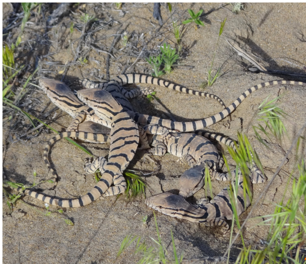
Рисунок 4 – Ювенильные особи серого варана

в полоску. Вариации рисунка спины у маленьких варанчиков такие же, как и у взрослых. Отмечались кольца на спине, крестообразное слияние полос, асимметричное смещение полос.