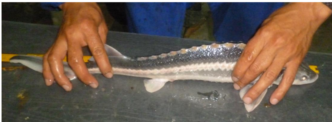
Сурет 1 – Орыс бекіресі Aguldenstadtii

Зерттеу нәтижелері. Тәжірибе жұмыстары жүргізгендегі бассейіндегі орыс бекіре балықтарының бастапқы салмағы 118,15г құрады. Тәжірибе жұмыстарын аяқтаған кезде соңғы олардың салмағы 122,32 г болды. Сонымен қатар балықтардың өміршеңдігі 88%, Фультон бойынша қондылық коэффициенті 0,60 г. Абсолюттік өсім 18,67 г, салыстырмалы өсім 13,85 г болды. Орыс бекіре шабағының өсу темпінің көрсеткіші төмендегі 1-ші кестеде көрсетілген.