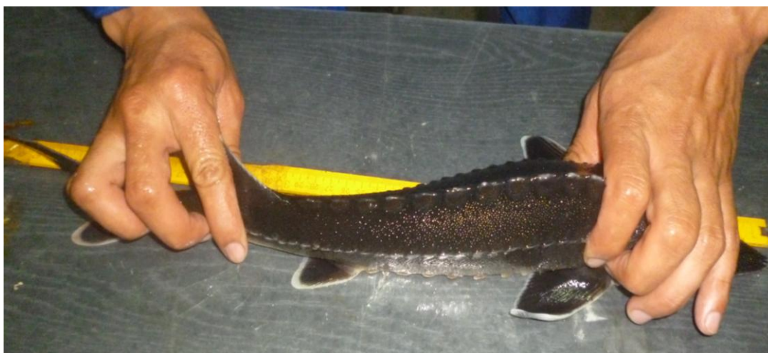
Сурет 2 – Сібір бекіресі Acipenser baeri

салмағы орыс бекіресінен төмен болатын. Зерттеу жұмыстары аяқталғаннан кейін сібір бекіре шабағының өсу темпі жоғары болып шықты. Сібір бекіресінің соңғы салмағы – 135,65 г құрады. Салыстырмалы өсім -16,6 %. Абсолюттік өсім – 20,45 г болды. Сібір және орыс бекірелері шабақтарының өсу көрсеткіштері салыстырмалы 3-ші кестеде және 1 суретте көрсетілген.