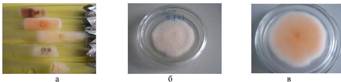
Рисунок 1 – Пересадка (а) и чистые культуры патогенов корневой гнили (б, в)