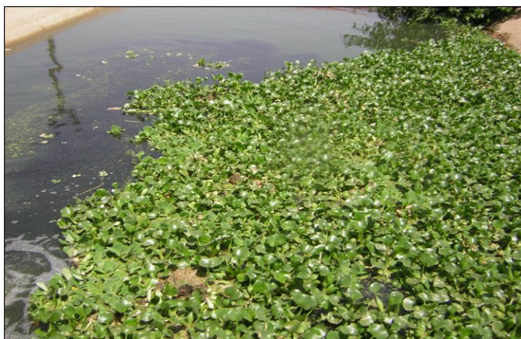
Рисунок 2 – Рост макрофитов на биопрудах МГПЗ